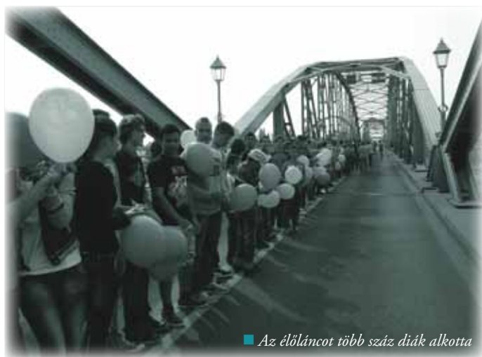
■ Az élőláncot több száz diák alkotta

Szeptember 1-jén volt 120 éve annak, hogy átadták a forgalomnak az Erzsébet hidat. A jeles napról Észak- és Dél-Komárom önkormányzata is megemlékezett, meghozzá egy diákokból álló élőlánccal.