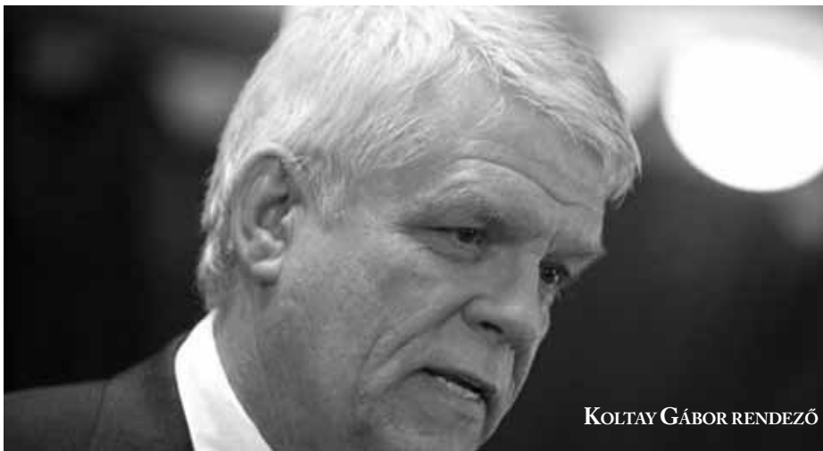
KOLTAY GÁBOR RENDEZŐ

A Komáromi Televízió és a Híd Televízió június 4-én 18:30 órakor mutatja be Koltay Gábor 2004-ben készült Trianon-filmjét. A rendezővel az alkotás megszületéséről, hányattatásáról és aktualitásáról beszélgettünk.