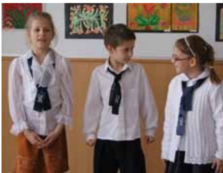
A NÉMET KISEBBSÉGI SZAVALÓVERSENYEN

Évek óta működik a német kisebbségi önkormányzat Komáromban, ám sokáig nem igazán tudták kivenni részüket a város életéből. Manapság azonban sorra szervezik a versenyeket, bálakat, sőt az oktatás területén is hatalmas előrelépést terveznek.