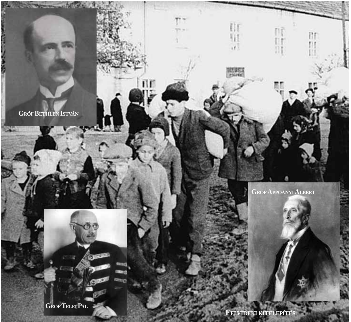
GRÓF BETHLEN ISTVÁN