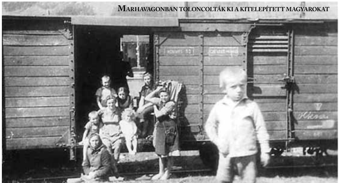
MARHAVAGONBAN TOLONCOLTÁK KI A KITELEPÍTETT MAGYAROKAT

-Miben különbözik a Fehérlaposok az általatok korábban írt daraboktól?