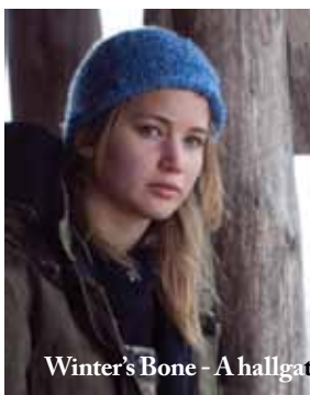
Winter's Bone - A hallgatás törvénye

12 év, 4 kontinensen több, mint 1000 koncert, több, mint harmincezer eladott lemez, több, mint félmillió km megtett út és hat lemez mentes év után „Kertünk alatt” címmel új anyagot mutat be a zenekar. Az új albumon százcsevásai, örkői és más cigány dalok, moldvai, mezősgéi magyar népdalok keverednek szerb, román, makedón dallamokkal, de felcsendül egy dél-indiai dallam is, ráadásként pedig egy egyedülálló Pacsirta feldolgozást találhatunk.