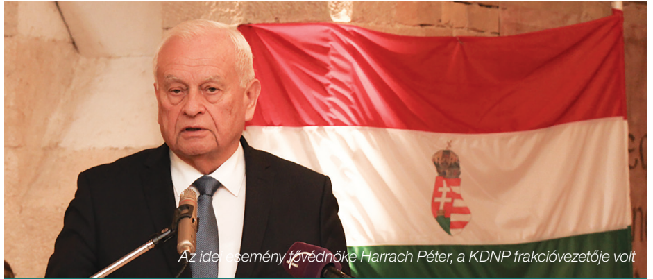
Az idei esemény fővédnöke Harrach Péter, a KDNP frakcióvezetője volt