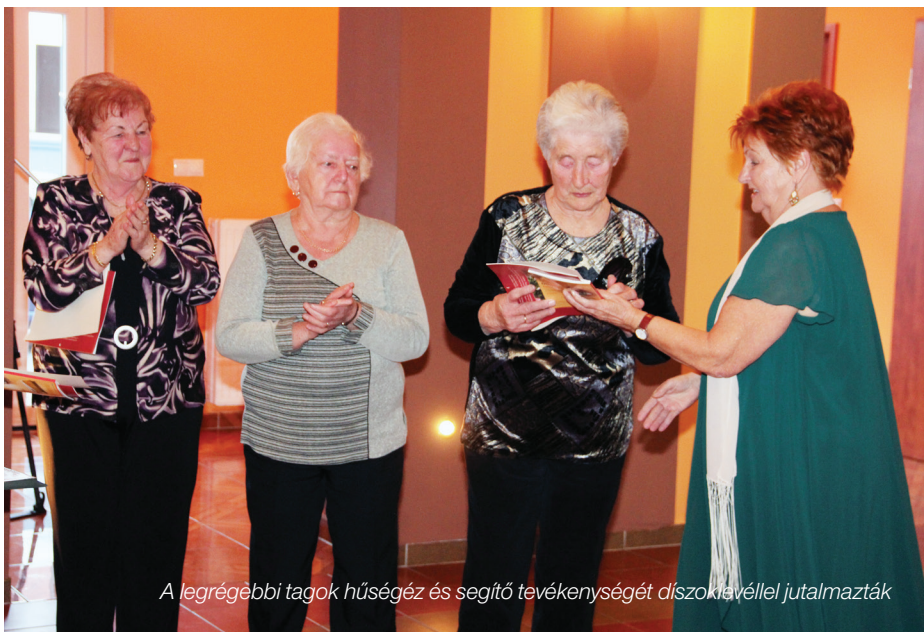
A legrégebbi tagok hűségét és segítő tevékenységét díszoklevéllel jutalmazták

SÉGET IS AD. A TAGSÁG NÉHÁNY HETE ÜNNEPELT.