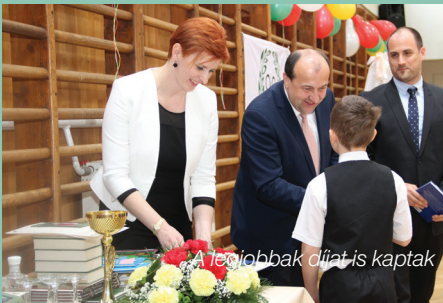
A legjobbak díjat is kaptak