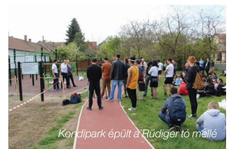
Kondipark épült a Rüdiger tó mellé