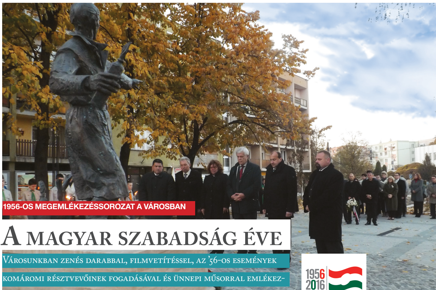
1956-OS MEGEMLÉKEZÉSSOROZAT A VÁROSBAN