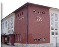
Cathedra Központ Komárom